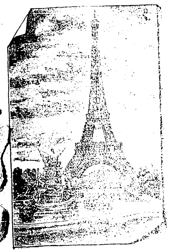
TORRE LITTLE A 18000 o call applica

Precisasso con para casa do 19 Îtabayatını, Palis nesta typearapeara